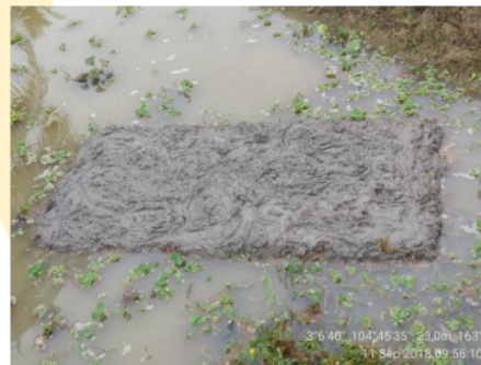
Gambar 5. Penanaman langsung diatas rakit apung