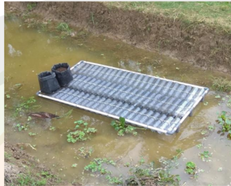
Gambar 2. Rakit apung untuk tanaman padi Gambar 3. Penanaman padi dalam polybag diatas pengapung

Penanaman padi juga dilakukan diatas rakit apung langsung, yaitu dengan meletakkan tanah lumpur diatas rakit (Gambar 4 dan 5). Pada bagian dasar (atas rakit) ditutupi dengan jerami (Gambar 4), kemudian diletakkan tanah lumpur (Gambar 5) setebal lebih kurang 10 cm.