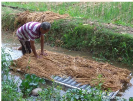
Gambar 4. Instalasi pengapung

Setelah rakit apung siap di tanami, maka di berakan lebih kurang 10 hari, menunggu benih tanaman padi tumbuh dan cukup untuk dapat dipindahkan (Gambar 6), yaitu umur 7 sampai 10 hari setelah semai. Jumlah bibit yang ditanam sebanyak 1 batang per rumpun (Gambar 7).