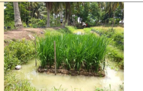
Gambar 9. Tanaman padi telah berumur 5 Minggu Setelah Tanam

Hasil penanaman padi pada budidaya tanaman padi dengan sistem pertanian terapung dari aspek agronomi diperoleh hasil pada Tabel 1 sebagai berikut :