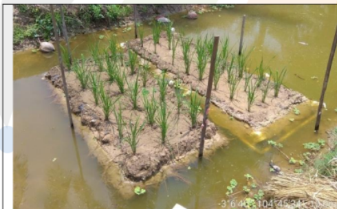
Gambar 8. Tanaman padi telah berumur 2 Minggu Setelah Tanam

Setelah itu dilanjutkan dengan pemeliharaan tanaman, yaitu pemupukan dan pengendalian gulma. Pertumbuhan tanaman padi 2 minggu setelah tanam (Gambar 8), dan tanaman padi telah keluar malai (Gambar 9).