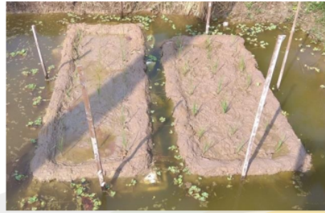
Gambar 7. Bibit telah ditanam diatas rakit apung, dengan 1 bibit per rumpun

Umur pindah bibit tanaman padi harus tepat untuk mengantisipasi perkembangan akar yang secara umum berhenti pada umur 42 hari sesudah semai, sementara jumlah anakan produktif akan mencapai maksimal pada umur 49-50 hari sesudah semai. Penanaman bibit muda memiliki beberapa keunggulan, antara lain tanaman dapat tumbuh lebih baik dengan jumlah anakan cenderung lebih banyak dan perakaran bibit berumur kurang dari 15 hari lebih cepat beradaptasi dan cepat pulih dari cekaman akibat dipindahkan dari persemaian ke lahan pertanaman.