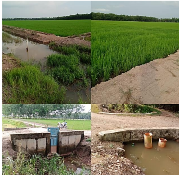
Gambar 3. Budidaya padi di tanah rawa pasang surut Delta Salek, Kabupaten Banyuasin, Sumatera Selatan.

Kadar nitrogen tanah tergolong sedang di tiga kelas hidrotografi lahan (A, B dan C) ini menunjukkan status hara nitrogen tergolong sedang (Tabel 3) sehingga lahan tidak perlu pemupukan nitrogen dengan dosis tinggi. Kondisi ini diikuti dengan kadar fosfor yang tergolong tinggi dan kadar kalium yang tergolong rendah. Tidak ada pengaruh kelas hidrotografi terhadap kesuburan tanah untuk kasus reklamasi di Delta Salek Kabupaten Banyuasin Sumatera Selatan. Ini berarti bahwa kesuburan tanah bukan merupakan faktor pembatas utama dan potensi produksi tanaman. Pembatas pengelolaan hanya terletak pada input perbaikan tata kelola jaringan tata air. Senada dengan hasil penelitian Taufiq dkk. (2019) yang menyatakan kandungan hara tanah terutama nitrogen dan fosfor di zona akar (0-20 cm) menunjukkan status sedang sampai tinggi. Peningkatan kadar aluminium pada tanah sulfat masam yang mengalami oksidasi pirit sangat berbahaya karena sangat berpengaruh terhadap pertumbuhan tanaman. Al dalam larutan tanah dapat menghambat penyerapan air dan nutrisi oleh tanaman (Quintal et al. , 2017), sehingga toksisitas Al mempunyai dampak dramatis pada pertumbuhan dan perkembangan tanaman yang menyebabkan penurunan hasil secara signifikan (Grevenstuck & Romano, 2013). Salah satu tanda paling jelas dari keracunan Al adalah terhambatnya pertumbuhan akar pada tanaman. Selain itu, telah terbukti bahwa