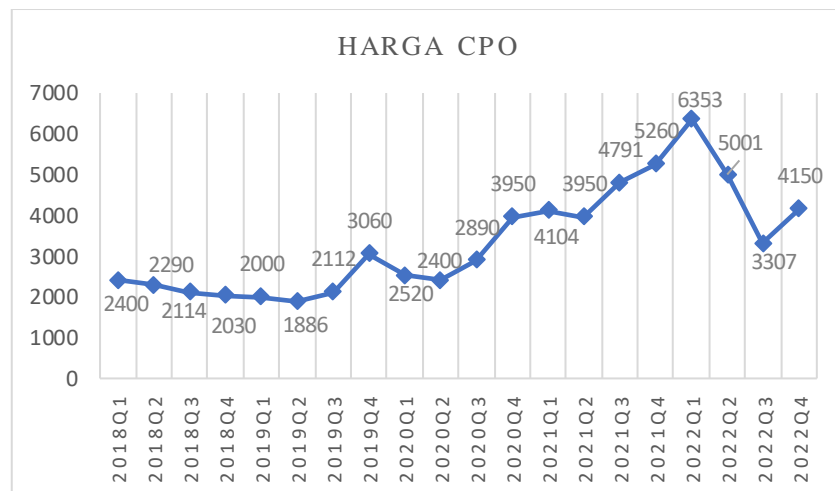
Grafik 1.2 Harga Crude Palm Oil Tahun 2018-2022 (Kuartalan)