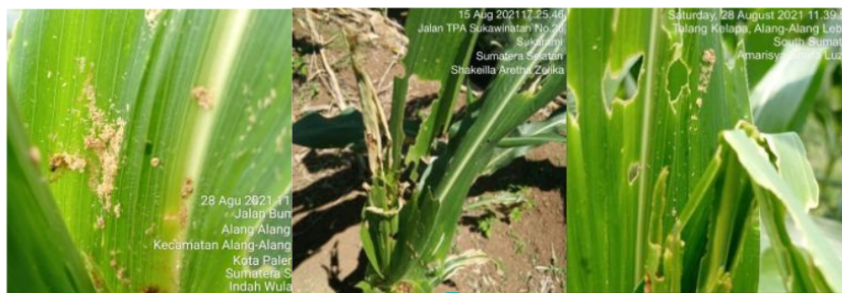
Gambar 1. Gejala serbuk gergaji akibat larva Spodoptera frugiperda pada tanaman jagung

S. frugiperda merupakan salah satu hama polypagus di Indonesia yang menyerang tanaman perkebunan. Namun, diketahui saat ini S. frugiperda lebih menyukai tanaman jagung. Serangan akibat hama yang juga disebut sebagai Fall Armyworm ini dapat berpotensi merugikan petani akibat perilakunya yang menyerang titik tumbuh tanaman sehingga dapat memicu kegagalan pembentukan pucuk daun (FAO & CABI, 2019). Bagian tanaman jagung yang dirusak oleh S. frugiperda ini meliputi akar, daun, dan tongkol jagung (Deole & Paul, 2018). Kerusakan yang disebabkan pun dapat dilihat dari adanya serbuk kasar yang menyerupai serbuk gergaji. Hal ini disebabkan akibat bekas gerakan larva pada permukaan atas daun (Gambar 1).