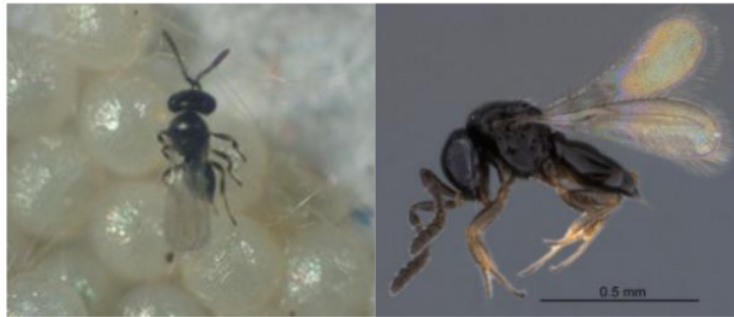
Gambar 2. Parasitoid telur Telenomus sp (Sari et al. , 2020) (Liao et al. , 2019)

Salah satu cara dalam mengendalikan populasi hama S. frugiperda adalah dengan mengandalkan keberadaan musuh alami, yaitu dengan parasitoid. Telenomus sp. merupakan salah satu musuh alami yang merupakan parasitoid pada telur S. frugiperda . Telenomus sp. memiliki ukuran tubuh yang sangat kecil, yaitu 0.8 mm (Souza et al. , 2015). Telenomus sp. dapat dikenali dari tubuhnya yang berwarna hitam dengan sayap belakang yang berukuran lebih kecil dari sayap depan dan hanya memiliki satu kait kecil. Telenomus sp. memiliki antena yang bersiku atau geniculate dan terdiri dari 10-11 ruas, sedangkan ujung tungkainya memiliki 5 ruas (Gambar 2).