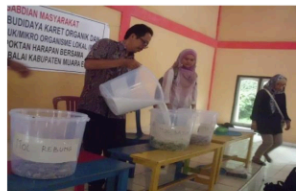
Gambar 8. Air Cucian Beras ditambahkan ke Bahan MOL