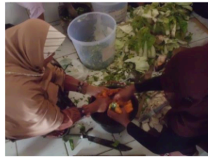
Gambar 6. Bahan yang dihaluskan dimasukkan ke dalam Ember