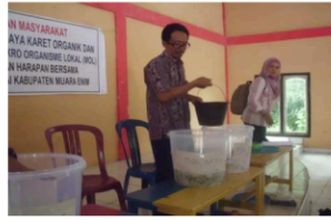
Gambar 9. Penambahan Gula Merah