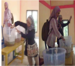
Gambar 11. Semua Bahan MOL diaduk secara Merata