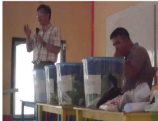
Gambar 4. Penyampaian materi tentang Sifat Biologi Tanah