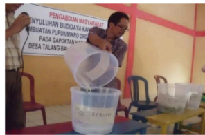
Gambar 7. Air Kelapa ditambahkan pada Bahan MOL