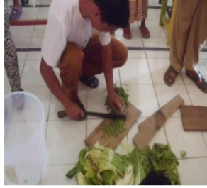
Gambar 5. Penghalusan Bahan