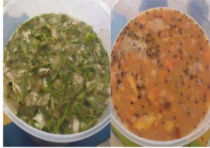
Gambar 10. Penambahan air bersih