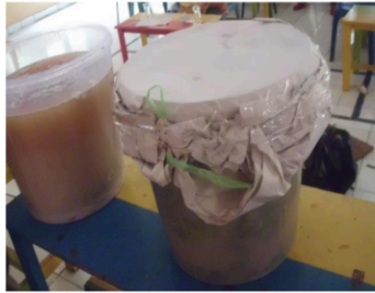
Gambar 13. MOL yang sudah selesai diproses dan didiamkan selama 13 hari.