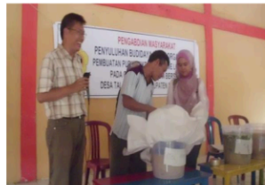
Gambar 12. Ember ditutup dengan kertas Koran