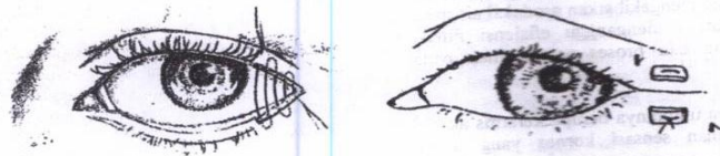
A. Serpentine sutured to close tarsoraphy site. B. 6-0 Silk suture tied over rubber band bolsters

Tindakan operasi dapat dilakukan pada kelainan mata kusta yang lanjut, tergantung pada manifestasi kelainan yang muncul. Jenis operasi yang dapat dilakukan adalah tarsoraf, ekstraksi katarak, tarsotomi, temporal muscle transfer. 1,2,4,9 Operasi tarsoraf bertujuan untuk mendekatkan margo palpebra yang tidak dapat lagi dirapatkan. Seperti pada keadaan lagoftalmus, ektropion danulkus kornea. 1,4,6