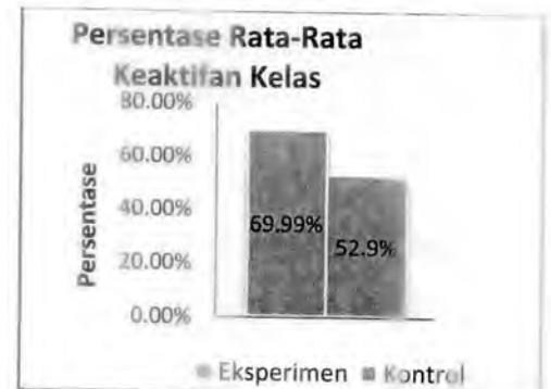
Gambar 4. Diagram Persentase Rata-Rata Keaktifan Kelas

Pada saat kegiatan pembelajaran berlangsung, baik pada kelas eksperimen maupun kelas kontrol dilakukan pengambilan data keaktifan siswa dengan cara observasi. Perbandingan persentase rata-rata keaktifan antara kelas eksperimen dan kontrol disajikan dalam gambar 4.