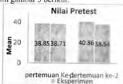
Gambar 3. Diagram Nilai Pretest Siswa

Kedua kelas diberi pretest untuk mengetahui kemampuan awal siswa sebelum diberi perlakuan. Nilai pretest siswa disajikan dalam gambar 3 berikut.