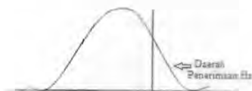
Gambar 2. Daerah penerimaan H_a