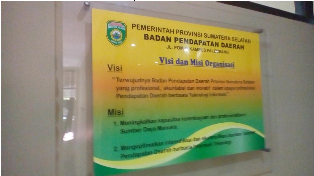
Gambar 1 : Visi dan Misi Badan Pendapatan Daerah Provinsi Sumatera Selatan