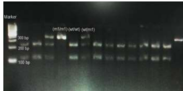
Gambar 1. Hasil elektroforesis gen CYP2C19*2 setelah direstriksi menggunakan enzim Sma I. Marker = DNA penanda, Genotip m1/m1 pada jalur 4 dan 15. Genotip wt/m1 pada jalur 3 dan 6, dan wt/wt pada jalur 1,2,5,7-13.

yaitu 56,7% : 30% : 13,3% dan distribusi frekuensi alel wt : m1 adalah 71,7% : 28,3%. Sedangkan distribusi genotip CYP2C19*3 wt/wt : wt/m1 : m1/m1 yaitu 96,7% : 3,3% : 0% dan distribusi frekuensi alel wt : m1 adalah 78,3% : 1,7%.