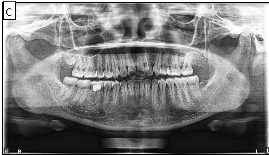
Gambar 3. Horizontal error