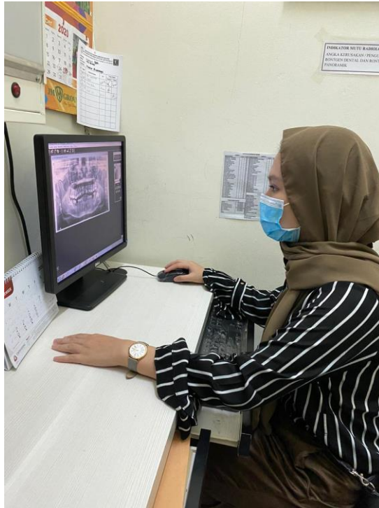
Gambar 10. Pengambilan data radiograf panoramik