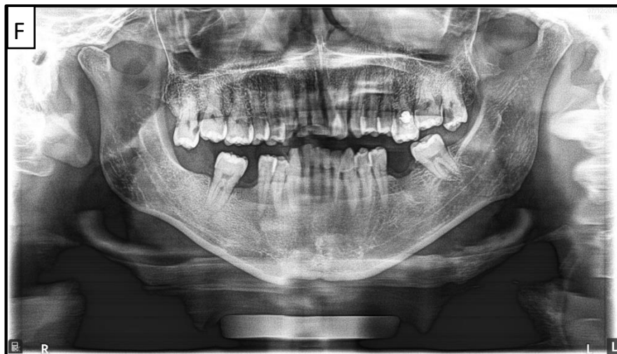
Gambar 7. Anteroposterior error