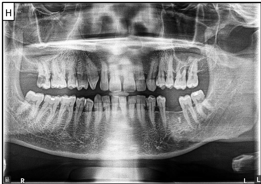
Gambar 9. Posisi tulang belakang tidak lurus