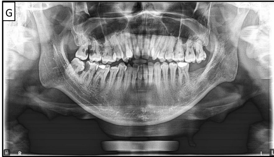
Gambar 8. Pengaturan ketinggian yang tidak benar