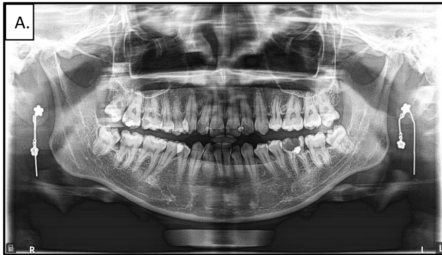
Gambar 1. Pasien menggunakan perhiasan