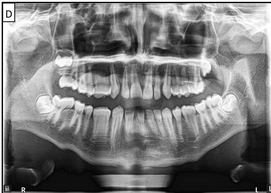
Gambar 4. Pasien bergerak