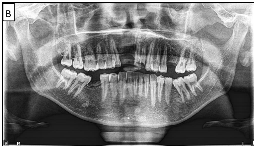
Gambar 2. Tidak berkontakannya lidah dengan palatum