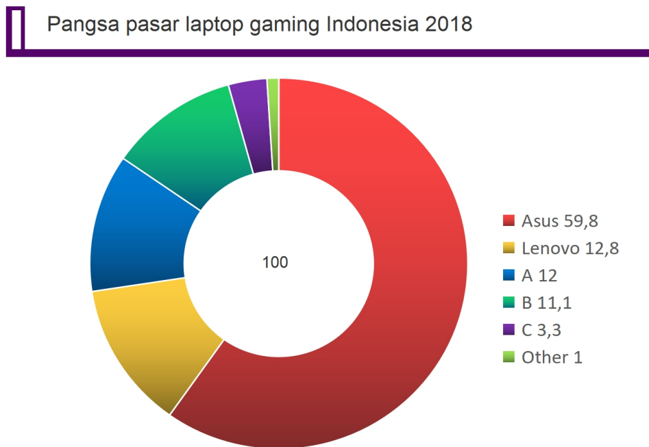
Gambar 1.2 Pangsa Pasar Laptop Gaming Indonesia 2018

Di Indonesia sendiri, laptop gaming sudah cukup banyak dikenal dikalangan masyarakat. Hal ini dengan sudah banyaknya perusahaan yang bergeliat di sektor ini. Beberapa perusahaan itu ialah Asus dengan subbrandnya seperti ROG, Acer (Predator), Lenovo (Legion), Dell (Alienware), Razer, MSI, dan HP (Pavilion).