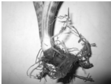
GAMBAR 2. Penampang akar Tanaman Lidah Mertua ( Sansevieria trifasciata Prain )

Akar tanaman Hanjuang ( Cordyline frucosa ) dan Sambang Dara ( Excoecaria cochiniensis ) memiliki bagian ujung dan pangkal akar yang berukuran hampir sama besar. Akar tanaman tersebut juga memiliki cabang-cabang halus yang menyebar keseluruhan media tanah, sehingga tanaman Hanjuang ( Cordyline frucosa ) dan Sambang Dara ( Excoecaria cochiniensis ) mampu menyerap logam Pb dari bagian bawah tanah dan menyebabkan kandungan Pb pada tanaman Hanjuang ( Cordyline frucosa ) lebih besar dibandingkan pada tanaman lainnya. Sedangkan kandungan logam Pb terendah yaitu Lidah Mertua ( Sansevieria trifasciata Prain ) yaitu 38,97 mg.kg -1 . Rendahnya kandungan logam Pb pada tanaman Lidah Mertua ( Sansevieria trifasciata Prain ) karena volume perakaran dimiliki sangat sedikit (Gambar 2). Akar tanaman Lidah Mertua ( Sansevieria trifasciata Prain ) memiliki akar rimpang dan cabang-cabang akar yang dimiliki tidak banyak sehingga akar tanaman tidak menyebar ke seluruh arah di dalam tanah, maka akar tanaman Lidah Mertua ( Sansevieria trifasciata Prain ) hanya menyerap logam Pb yang berada disekitar akar primernya.