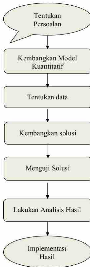
Gambar 1.2. Prosedur Analisis Kuantitatif

berbeda-beda pula. Oleh karena itu, sebelum menentukan cara apakah yang harus digunakan untuk membahas, atau mengatasi persoalan yang dihadapi menejer tersebut perlu terlebih dahulu memahami pokok persoalan ekonomi dan bisnis yang akan dibahas secara lebih tepat. Batasilah, dan nyatakan dengan tegas dan jelas persoalan yang akan dibahas Selanjutnya, melalui data yang tersedia pihak menejer dapat memutuskan apakah yang seyogyanya harus dilakukan .