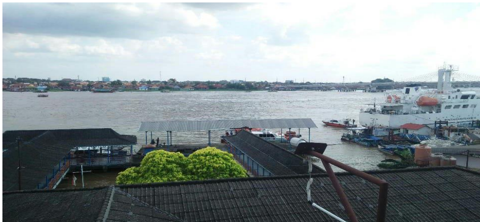
Gambar 1. Lokasi Pelayanan Pemanduan Kapal di Pelabuhan Indonesia II (Persero) Cabang Pelabuhan Palembang

Indonesia merupakan negara kepulauan yang memiliki 17.504 pulau yang tersebar di 34 provinsi. Tidak heran jika banyak pelabuhan dan kapal yang tersebar di Indonesia. Salah satunya pelabuhan yang terletak di Palembang yaitu Pelabuhan Indonesia II (Persero) Cabang Pelabuhan Palembang. Jasa pemanduan ialah kegiatan pandu dalam membantu, memberikan saran dan informasi kepada nahkoda tentang keadaan perairan. Jasa pelayanan pemanduan kapal merupakan pelayanan pertama dan terakhir yang diberikan kepada kapal yang akan singgah di suatu pelabuhan. Oleh sebab itu, hal ini menjadi sangat penting pelayanan pemanduan untuk terus meningkatkan kualitas pelayanannya.