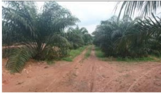
Gambar 1. Jalan utama perkebunan kelapa sawit lokasi penelitian

lokasi menggunakan kamera (Gambar 1 dan 2) dan penetapan batas wilayah lahan menggunakan GPS Garmin untuk menentukan luas lahan dan data track peta dasar. Foto lokasi penelitian disajikan pada, Pembuatan peta dasar dilakukan menggunakan aplikasi ArcGIS 10 menggunakan data track GPS sehingga dihasilkan data batas wilayah lokasi penelitian. Penentuan titik pengamatan dan pengambilan sampel tanah dilakukan menggunakan aplikasi ArcGIS 10 dengan bantuan grid berukuran 100 x100 m sehingga didapat hasil akhir berupa peta dasar lahan penelitian (Gambar 3).