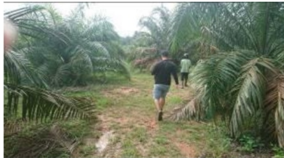
Gambar 2. Jalan antara baris kelapa sawit lokasi penelitian