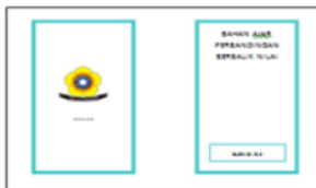
Gambar 1. Storyboard Halaman Loading dan Cover Bahan Ajar

Tahap Desain Merancang Produk. Pada tahap ini peneliti membuat desain tampilan bahan ajar dengan menggunakan sketsa berupa kerangka isi bahan ajar dan storyboard. Kerangka isi bahan ajar memuat struktur isi dalam bahan ajar yang meliputi (1) petunjuk penggunaan bahan ajar, (2) materi yang berisi petunjuk belajar, kompetensi yang harus dicapai, informasi pendukung untuk menjawab permasalahan, materi perbandingan berbalik nilai dan latihan, (3) kuis yang berisi soal pilihan ganda sebanyak 5 soal, dan (4) profil peneliti. Setelah menyusun kerangka isi bahan ajar selanjutnya peneliti menyusun storyboard. Tujuan penyusunan storyboard adalah untuk memberikan gambaran rancangan produk secara lebih jelas. Hasil rancangan storyboard dari beberapa menu dalam bahan ajar perbandingan berbalik nilai berbasis android diperlihatkan pada gambar 1, gambar 2, dan gambar 3.