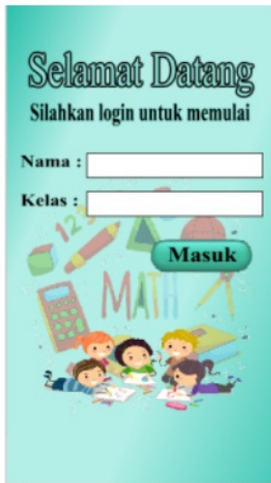
Gambar7. Perbaikan Tampilan Log-In