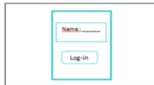
Gambar 2. Storyboard Halaman Log-in Bahan Ajar