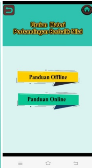
Gambar 8. Perbaikan Tampilan Uraian Materi