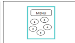
Gambar 3. Storyboard Halaman Menu Utama Bahan Ajar