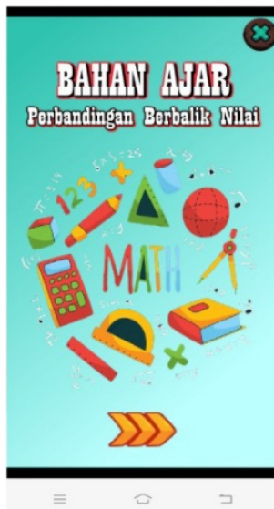
Gambar 4. Tampilan Cover Bahan Ajar.

Tahap Development Pembuatan Produk. Pada tahap ini, peneliti memproduksi bahan ajar perbandingan berbalik nilai. Dalam memproduksi bahan ajar ini peneliti memulai dengan mengetik isi dalam bahan ajar, pembuatan animasi dan pendesaianan tampilan background bahan ajar dengan menggunakan bantuan dari software adobe photoshop, camtasia dan Microsoft office powerpoint. Setelah itu dilanjutkan dengan memasukkan gambar, teks, suara, dan animasi yang telah dibuat kedalam bahan ajar menggunakan bantuan software Adobe 16 sh Professional Cs 6. Tampilan dari bahan ajar yang dikembangkan peneliti dapat dilihat pada Gambar 4., Gambar 5. dan Gambar 6.