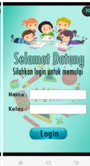
Gambar 5. Tampilan Log-in Bahan Ajar.