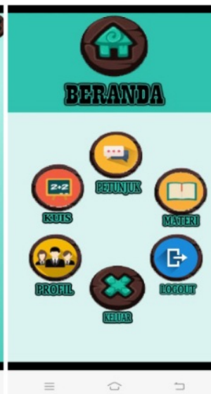
Gambar 6. Tampilan Menu Bahan Ajar.