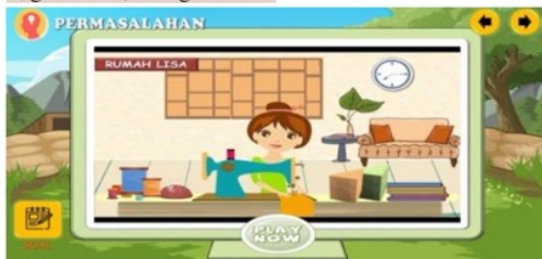
Gambar 5 Revisi video permasalahan

Perbaikan pada aplikasi yang sudah dibuat oleh peneliti berdasarkan saran maupun komentar dari validator merupakan hasil dari persetujuan dosen pembimbing mengenai perubahan-perubahan yang dilakukan oleh peneliti. Adapun hasil revisi yang sudah dilakukan oleh peneliti diperlihatkan pada gambar 5, gambar 6, dan gambar 7.