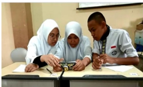
Gambar 9 Uji Coba small group kelas IX

Setelah selesai menggunakan bahan ajar yang sudah dibuat peneliti, selanjutnya siswa diberikan lembar angket yang berisikan pernyataan negatif maupun positif. Lembar angket tersebut haruslah diisi oleh siswa sesuai dengan tanggapan mereka masing-masing mengenai tanggapan siswa tentang bahan ajar yang sudah digunakan. Hasil dari lembar angket pada tahap small group terlihat pada tabel 3 selain itu ada pula komentar maupun saran yang siswa berikan terhadap bahan ajar.