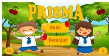
Gambar 2 Tampilan awal aplikasi

Pada tahap pengembangan, dalam proses pembuatan produk yang dilakukan terlebih dahulu ialah desain yang sudah di buat oleh peneliti pada storyboard selanjutnya dikembangkan menjadi sebuah aplikasi dengan menggunakan sebuah software yaitu Android Studio dan menggunakan bantuan dari aplikasi lain seperti Powerpoint, Photoshop CS3, Paint, Camtasia , dan Filmora dalam pembuatan background, button, simbol, feedback, video , serta kuis yang berkaitan dengan materi prisma. Tampilan dari bahan ajar yang dibuat oleh peneliti diperlihatkan pada gambar 2, gambar 3 dan gambar 4.