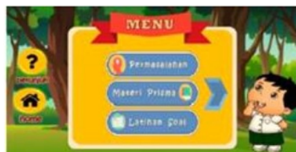
Gambar 3 Menu aplikasi