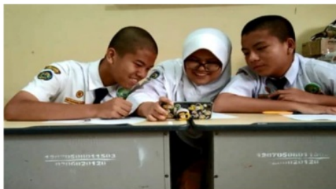
Gambar 8 Uji coba small group kelas VIII