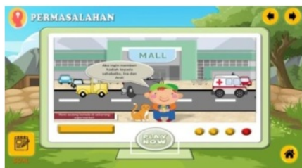
Gambar 4 Video permasalahan

Pada tahapan validasi ahli, peneliti menunjukkan aplikasi yang sudah peneliti buat