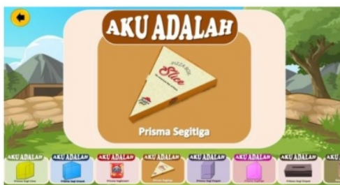
Gambar 6 Revisi contoh prisma