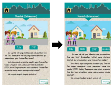
Gambar 5. Perbaikan tampilan masalah determinan

Gambar 5 menunjukkan salah satu perbaikan yang dilakukan pada bahan ajar.