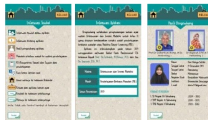
Gambar 3. Tampilan menu “Tentang Aplikasi”

Komponen aplikasi ini diadaptasi dari sistematisasi bahan ajar Depdiknas (2008) yang menurutnya paling tidak mencakup: petunjuk belajar, kompetensi yang akan dicapai, konten atau isi materi pembelajaran, informasi pendukung, latihan-latihan, petunjuk kerja, evaluasi, dan respon atau umpan balik terhadap hasil evaluasi.