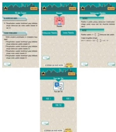
Gambar 2. Tampilan menu belajar

Aplikasi bahan ajar Determinan dan Invers Matriks terdiri dari beberapa komponen yang menyusunnya, yaitu halaman awal, menu “Belajar” yang terdiri dari KD dan tujuan, masalah, materi, kuis dan tes (lihat Gambar 2.); dan menu “Tentang Aplikasi” yang terdiri dari informasi tombol, informasi aplikasi, dan profil pengembang (lihat gambar 3.).