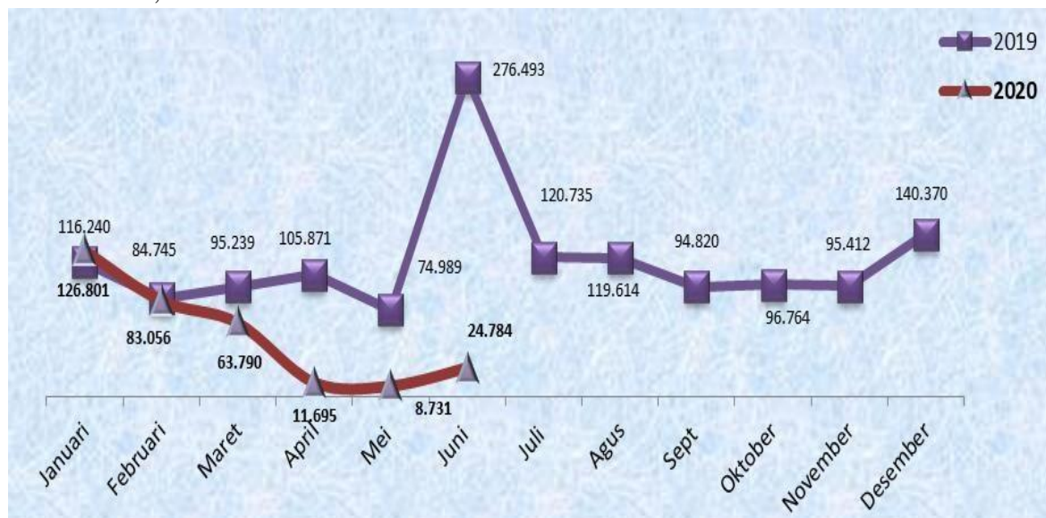
Gambar 1. 1 Grafik Perkembangan Keberangkatan Penumpang Melalui Pelabuhan Bakauheni Lampung Januari 2019 s.d Juni 2020

83.056, sedangkan bila dibandingkan dengan tahun 2019 dibulan yang sama turun sebesar 33,02 %.