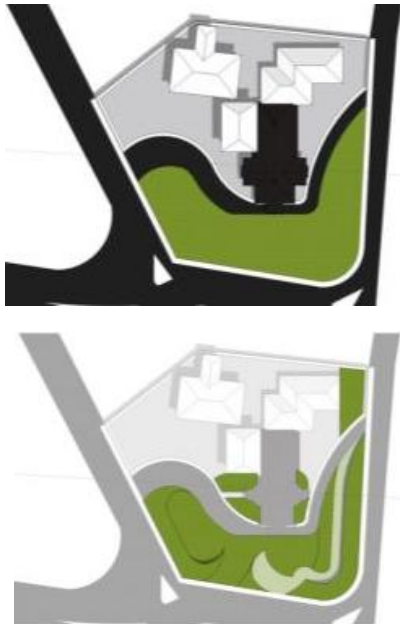
Gambar 7. Diagram Zona Bangunan dan Tata Hijau