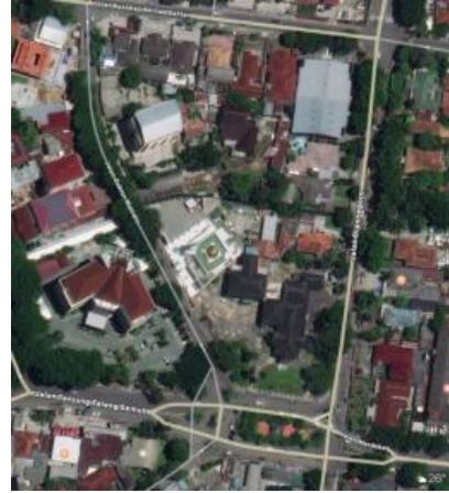
Gambar 1. Peta Delineasi Kawasan Museum Tekstil