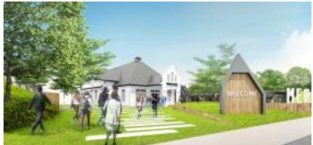
Gambar 16. Pola Pergerakan yang Fleksibel dan Leluasa