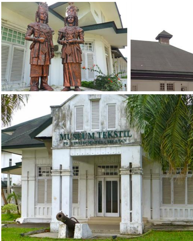
Gambar 3. Elemen Visual Eksisting Museum Tekstil

Secara visual dan estetis, karakter kolonial sangat terasa kuat didukung dengan adanya beberapa bukti sejarah yang masih terlihat diantaranya terdapat satu meriam di depan gedung. Selain itu, juga terdapat patung pengantin pria dan wanita berpakaian adat Sumatera Selatan. Selain karakter kolonial, pada bangunan utama juga memiliki kekhasan gaya arsitektur art deco yang memang sering terlihat di beberapa bangunan kolonial.