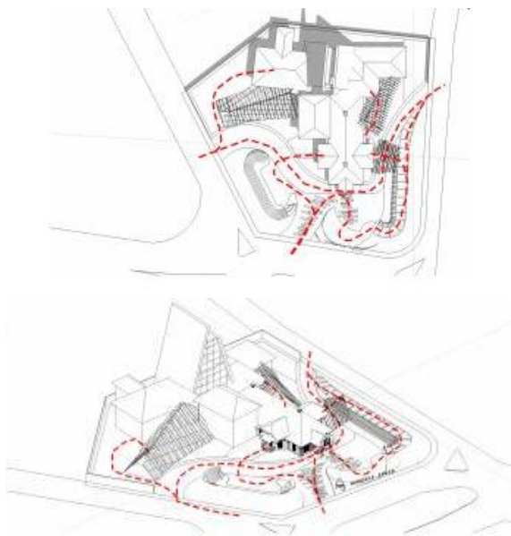
Gambar 10. Skema Alur dan Pola Pergerakan Aktivitas

Untuk mendukung pola ini diperlukan sebuah layout kawasan yang terbuka dengan mengoptimalkan pedestrian di setiap sisi kawasan. Hal ini dapat memudahkan pengguna untuk mengakses setiap sisi bangunan dengan mudah namun dengan tetap diperkuat beberapa signage sebagai penanda arah.