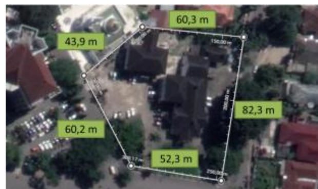
Gambar 6. Luas Eksisting Kawasan Museum Tekstil

Dari hasil identifikasi dan deliniasi kawasan, terlihat bahwa kawasan Museum Tekstil ini berada sangat strategis di salah satu pusat Kota Palembang yang dikelilingi beragam fungsi bangunan. Beberapa diantaranya bangunan perkantoran pemerintahan, sekolah, masjid, hingga rumah sakit yang membuat kawasan ini memiliki fungsi yang penting dalam aktivitas masyarakat. Namun, fungsi Museum Tekstil yang semakin menurun sebagai akibat tidak terawat dengan baik. Konsep adaptive reuse dipilih sebagai salah satu bagian dari upaya konservasi bangunan secara menyeluruh.