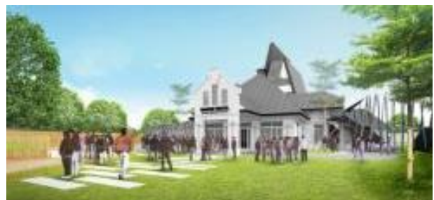
Gambar 15. Pusat Kegiatan Kreatif Masyarakat