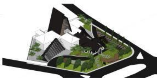
Gambar 11. Ilustrasi Desain Awal Reimagined Museum Tekstil

Secara umum, diagram pentahapan reimagined dan adaptive reuse pada museum tekstil dapat digambarkan sebagai berikut.