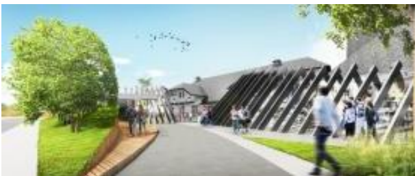
Gambar 13. Intervensi Elemen Desain Baru yang Selaras