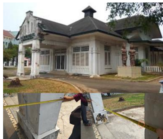
Gambar 4. Proses Pengukuran Bangunan

Melihat kondisi eksisting dari kawasan Museum Tekstil, perlu dilakukan upaya identifikasi awal terkait permasalahan dan potensi yang ada sehingga upaya yang dilakukan dapat tepat sasaran. Setelah memetakan dan memberi batas delineaasi sesuai dengan kondisi di lapangan, perlu dibuatnya modeling awal bangunan eksisting yang ada. Dalam menghasilkan modeling bangunan maka perlu dilakukan survey dan pengukuran untuk mendapatkan hasil yang sesuai.