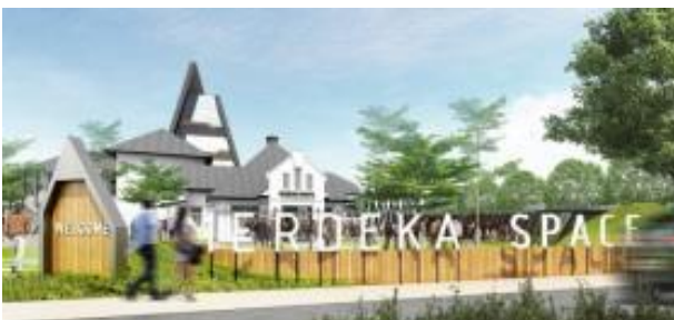
Gambar 14. Reimagined Museum Tekstil Menjadi Merdeka Space