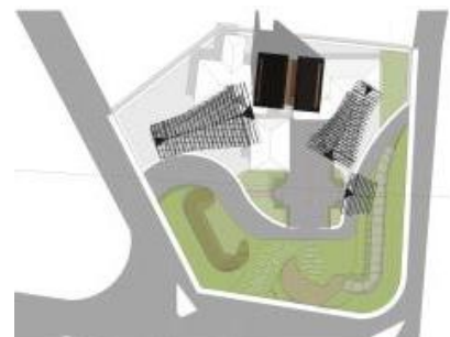
Gambar 9. Penempatan Fungsi Baru dan Ruang Terbuka