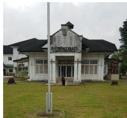
Gambar 2. Kondisi Eksisting Museum Tekstil