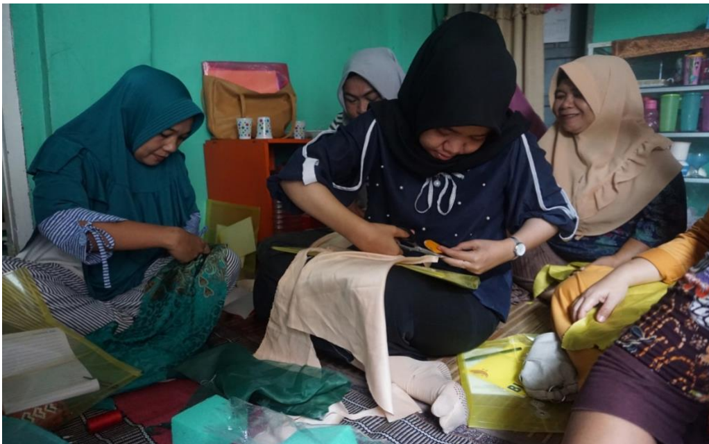
Gambar 4. Peserta mempraktekkan pembuatan Bros Yang di ajarkan Narasumber

Selanjutnya, lipatan kain perca tersebut ditusuk dengan jarum pentul agar bentuknya tidak berubah. Guntinglah ujung lipatannya. Lipatan perca tadi di jahit satu persatu. Lalu, matikan ikannya hingga lipatan perca pertama bertemu dengan lipatan perca terakhir yang terangkai. Tinggal dirapikan bentuknya, di beri kancing tengahnya dan peniti untuk bros di belakangnya.