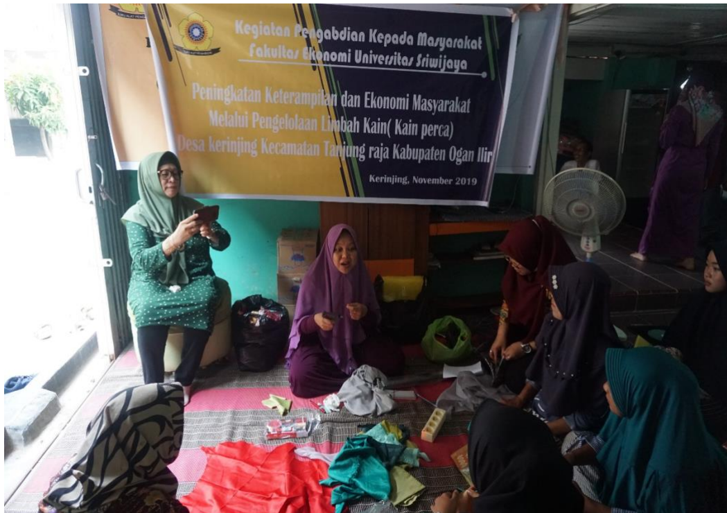
Gambar 2. Nara Sumber Menjelaskan Materi dan Cara Pembuatan

tembak, alat lem tembak, peniti, jarum, benang, Kain perca atau limbah kain, manik-manik untuk hiasan tambahan.