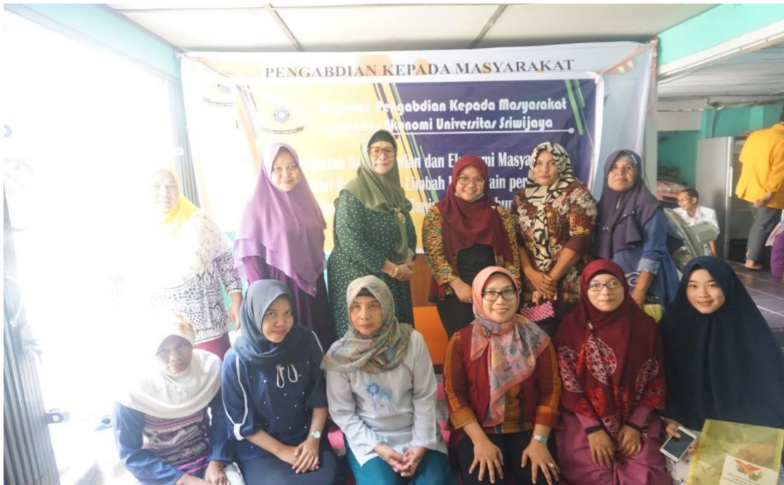
Gambar 5. Foto Bersama

berakhirilah pelatihan pengelolaan limbah kain atau kain perca (pembuatan Bros) di Desa Kerinjing.