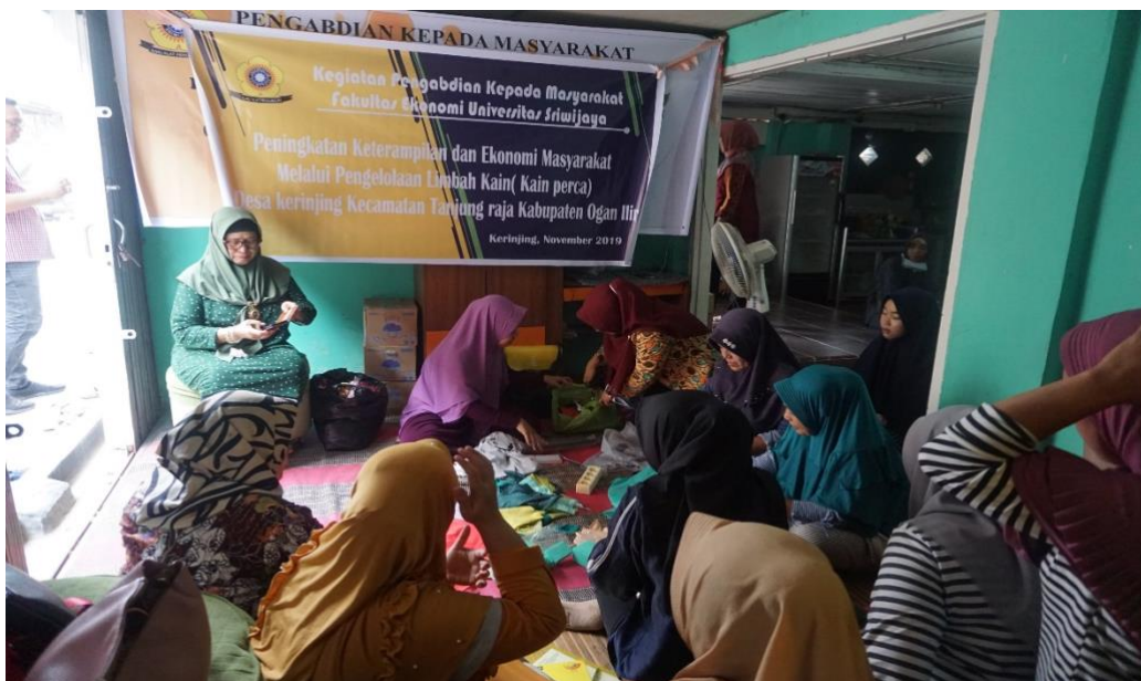
Gambar 1 Pembukaan dan Kata Sambutan

Kegiatan pengabdian kepada masyarakat ini dimulai dengan pembukaan oleh perwakilan masyarakat yang diwakilkan oleh Kepala Desa Kerinjing, Kecamatan Tanjung Raja, Kabupaten Ogan Ilir, Provinsi Sumatera Selatan dan juga kata sambutan dari ketua pelaksanaan kegiatan pengabdian.