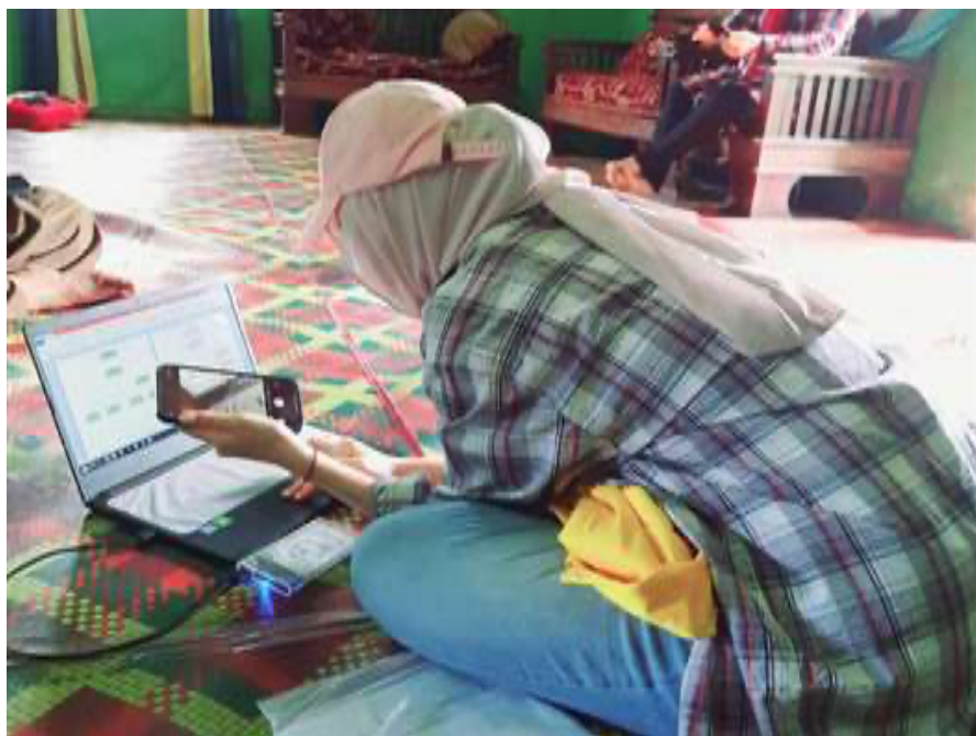
Kegiatan Wawancara di rumah Sekretaris Desa