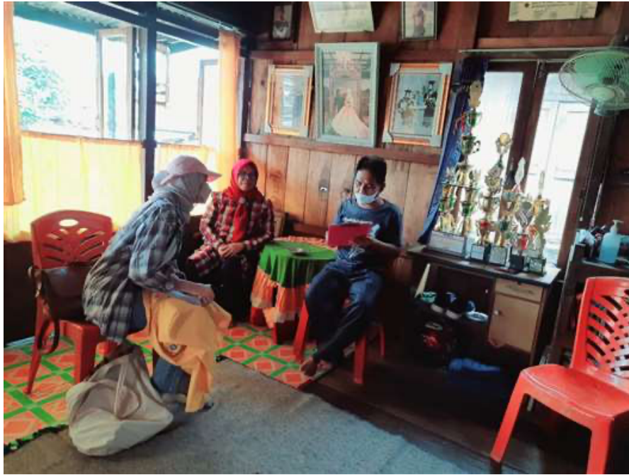
Kegiatan Wawancara bersama Kepala Desa Sakatiga Seberang