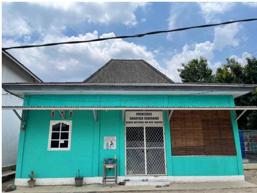
POS Kesehatan Desa Sakatiga Seberang