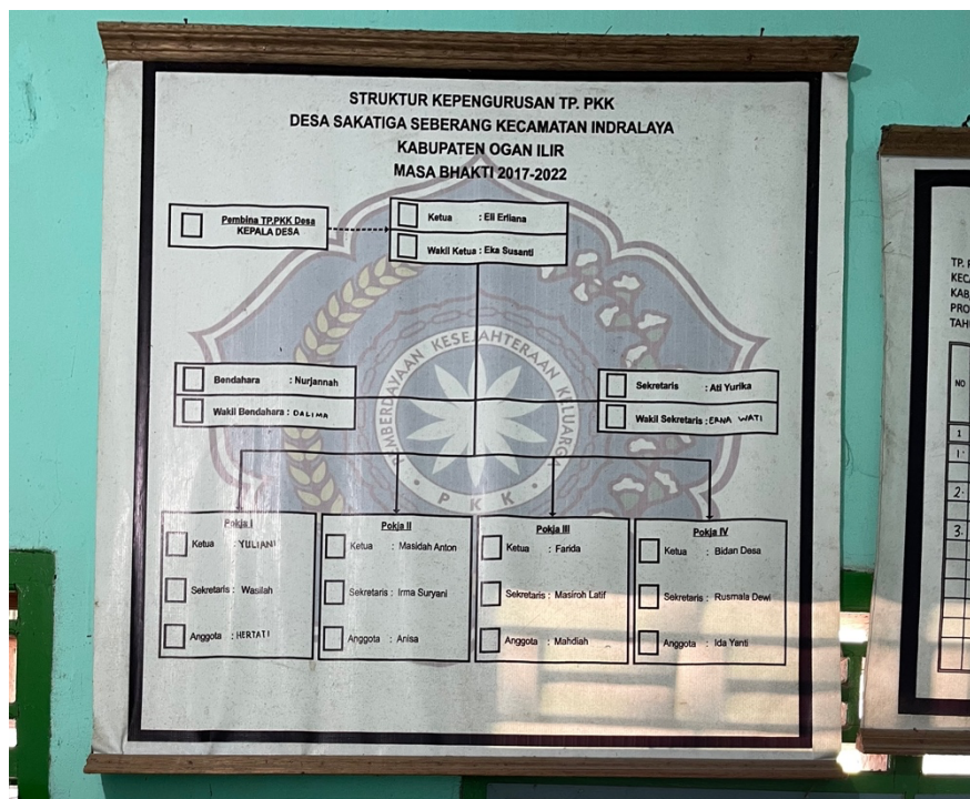
Struktur kepengurusan TP. PKK Desa Sakatiga Seberang