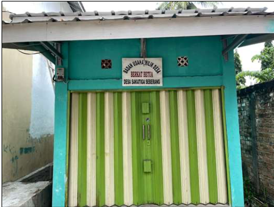
Gedung Badan Usaha Milik Desa Berkat Betua