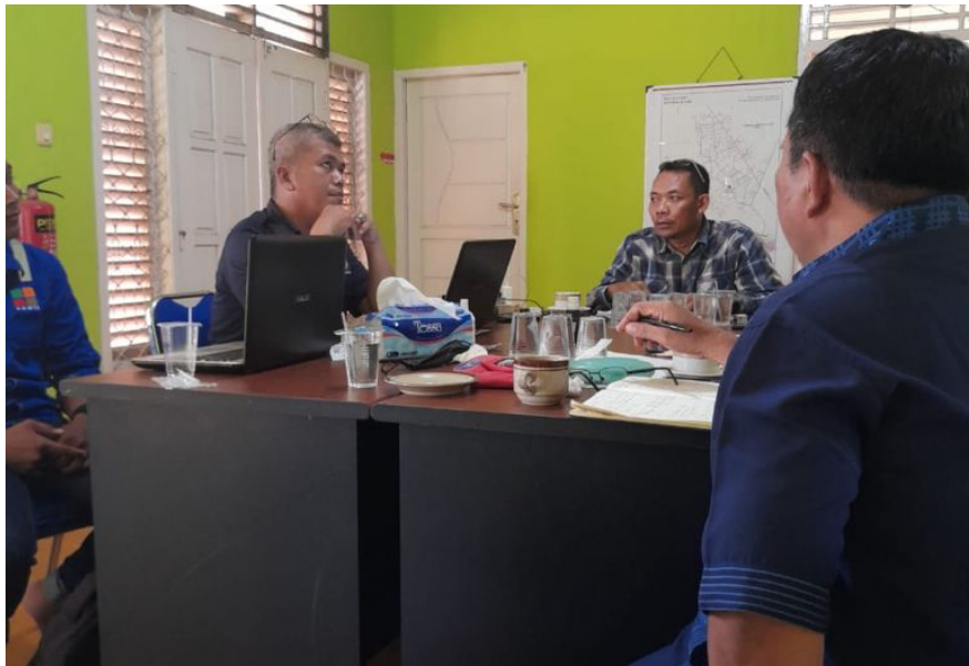
Kegiatan FGD dengan Badan Pengurus Desa