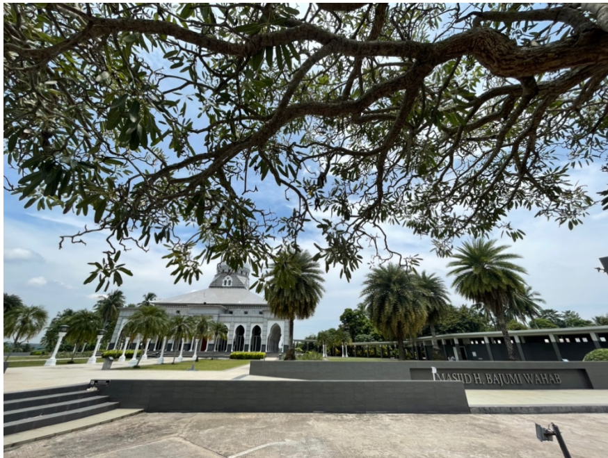
Sarana dan Prasarana keagamaan di Desa Sakatiga Seberang