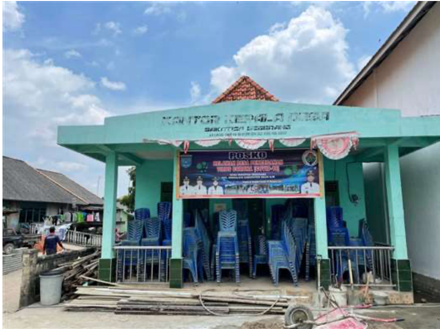
Kantor Kepala Desa Sakatiga Seberang