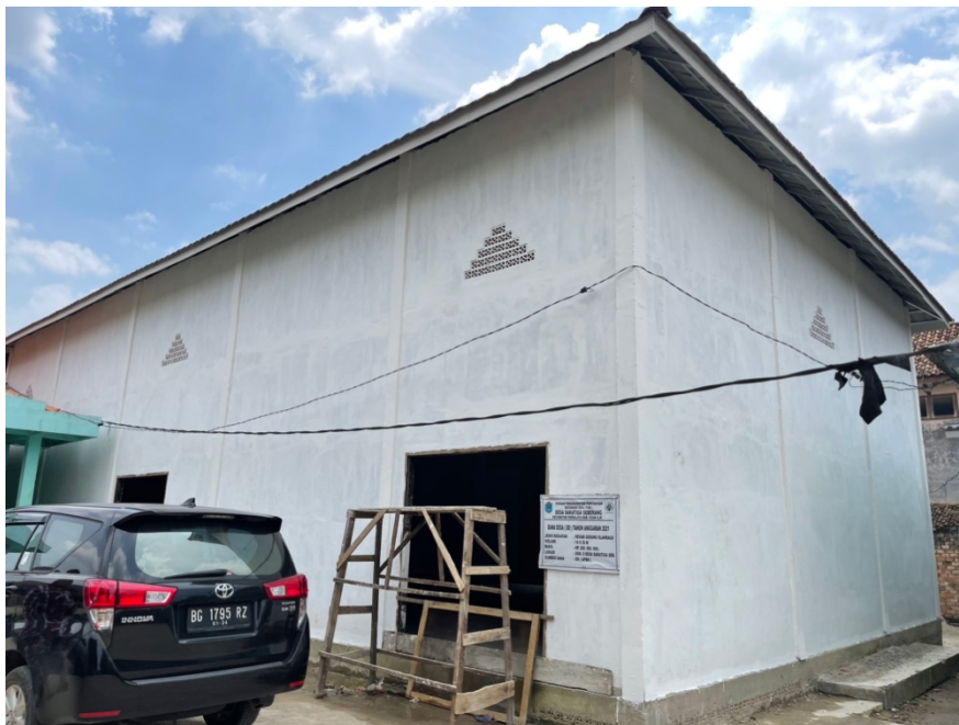
Gedung Balai Desa di Sakatiga Seberang