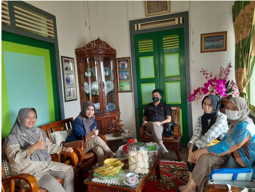
Kegiatan FGD dengan ibu-ibu PKK