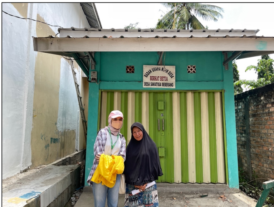
Foto bersama salah satu pengurus BUMDes Berkat Betua