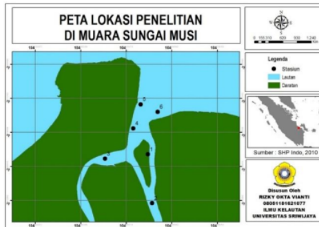
Gambar 1. Peta lokasi penelitian

2°19'22,5" S) dan Stasiun 6 (104°56'2,1" E - 2°19'47,4" S). Penanganan dan analisis sampel dilakukan di Laboratorium Mikrobiologi, Balai Besar Laboratorium Kesehatan (BBLK) Palembang.