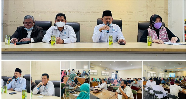
SOSIALISASI | Suasana sosialisasi penyusunan SKP format baru bagi dosen dan tenaga kependidikan di lingkungan FITK.