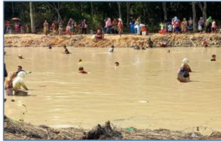
Gambar 1: Proses Pelaksanaan Tradisi Nanggok Ikan di Prabumulih.

Nanggok ikan adalah kegiatan mengambil ikan di sungai yang dilakukan secara berkelompok. Biasanya kegiatan ini hanya dilakukan oleh masyarakat dan telah menjadi rutinitas setelah musim kemarau tiba.