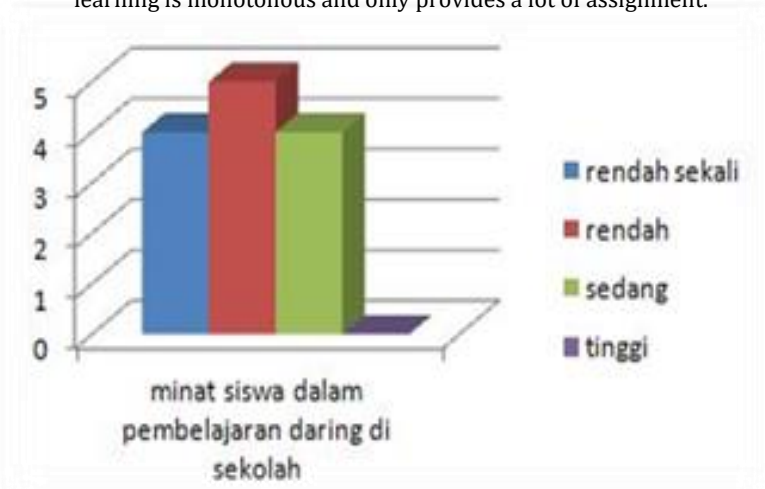
Figure 1: Students have a low interest in learning. Students think online learning is monotonous and only provides a lot of assignment.

Kumparan.com conducted an open survey to the majority of schools in the Jabodetabek area, questioning about teacher performance during the pandemic, in response to students' declining motivation in studying during the pandemic.