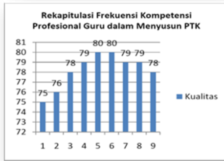
Figure 2: Teacher evaluation recapitulation data

Following the plan for the implementation of learning and teaching materials, and finally the evaluation is carried out to identify what needs to be improved and in order to improve the quality of learning in the future especially in the midst of Pandemic Covid-19.