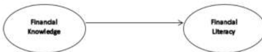
Gambar 1. Pengaruh Financial Knowledge terhadap Financial Literacy