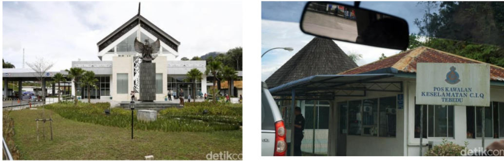
Gambar 1. Perbedaan Pos Lintas Batas Entikong (Indonesia) dan Tebedu Malaysia