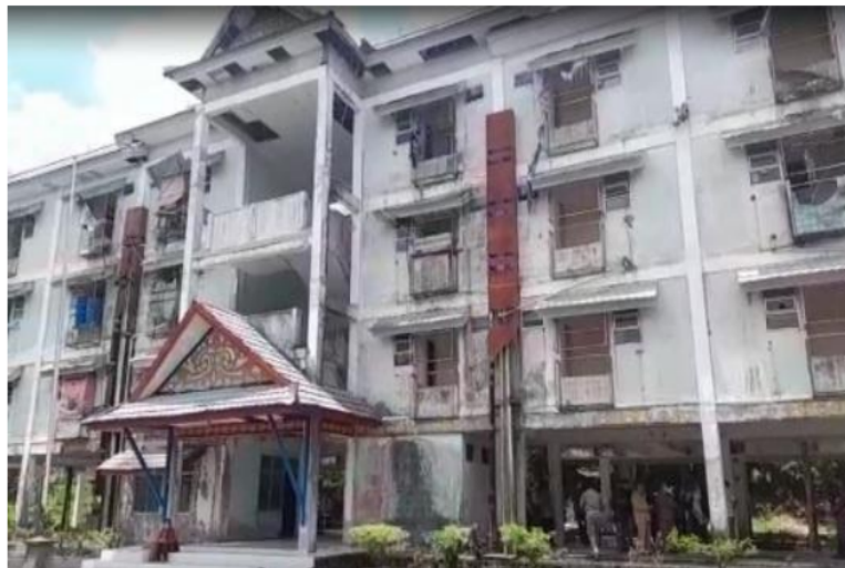
Gambar 2. Rusunawa terlantar

sebaiknya segera melakukan renovasi rusunawa ini agar bisa memberikan manfaat untuk masyarakat kawasan Entikong daripada dibiarkan terlantar dan seperti kawasan tanpa penghuni.