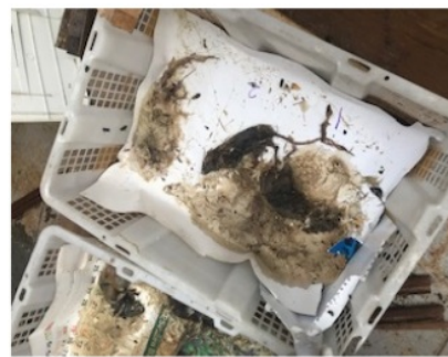
Gambar 8. Tubuh bangkai mengecil