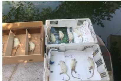
Gambar 4. Peletakan bangkai tikus berdasarkan kelompok penelitian