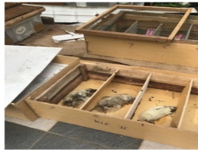
Gambar 6. Bangkai tikus mengeluarkan cairan