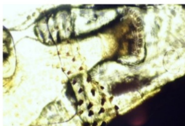
Gambar 1. Hasil pemeriksaan secara morfologi berdasarkan kunci identifikasi