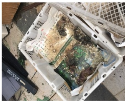
Gambar 7. Larva mengerubungi bangkai tikus