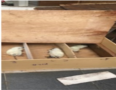
Gambar 5. Bangkai tikus mulai terjadi proses bloating