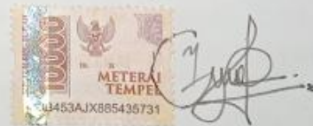
Rotama Saputra Gautama