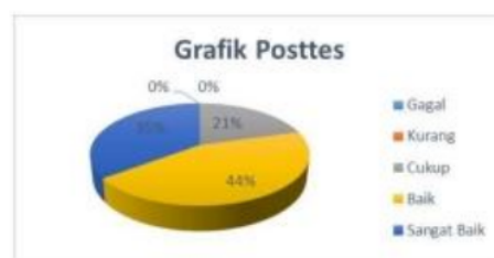
Grafik 2. Hasil Posttest

Berdasarkan perhitungan bahwa didapat sebanyak 0 peserta didik yang gagal dan kurang baik, 20,58% peserta didik yang cukup nilanya, 44,11% peserta didik yang memiliki kategori baik, dan 35,29% peserta didik dengan kategori sanga baik.