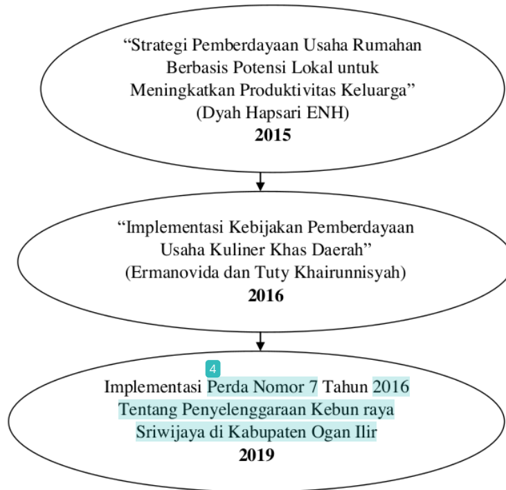
Gambar 2 Peta Jalan Penelitian