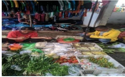
Gambar 4.3 Tempat Penjualan Bahan Pangan Kering

Produk makanan kering pertama-tama dikumpulkan dalam satu wadah berdasarkan jenis bahannya sebelum ditempatkan di keranjang sebagai meja atau alas. Akibatnya, komponen penilaian tabel tidak memenuhi kriteria evaluasi. Tempat sampah merupakan komponen evaluasi selanjutnya yang tidak sesuai dengan persyaratan penilaian. karena tidak adanya tempat sampah untuk area penjaja makanan kering pada saat observasi langsung di lapangan Setiap pedagang membuang sampahnya langsung ke Tempat Pembuangan Sampah Sementara (TPS) di area pasar pendopo untuk membuang sisa sampah hasil penjualan. Komponen evaluasi kedua adalah fasilitas cuci tangan tanpa ruang duduk. Karena diketahui melalui observasi penjual makanan kering hanya mengelap tangan dengan handuk, komponen cuci tangan tidak sesuai dengan persyaratan penilaian. Keberadaan vektor penular penyakit merupakan komponen akhir evaluasi yang tidak sesuai dengan persyaratan penilaian. Karena diketahui setelah observasi langsung di lapangan ternyata masih ada vektor seperti lalat yang berkeliaran di sekitar tempat penjualan.