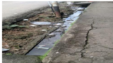
Gambar 4.8 Drainase Di Pasar Pendopo

Hasil pengamatan langsung dan pengisian lembar checklist menunjukkan bahwa drainase komponen tidak memenuhi persyaratan secara keseluruhan, seperti tidak tertutup kisi-kisi logam serta mudah dibersihkan, limbah cair tidak mengalir dengan lancar, limbah cair tidak memenuhi baku mutu, dan tidak ada bangunan di atasnya. Setiap enam bulan, kualitas efluen diuji.