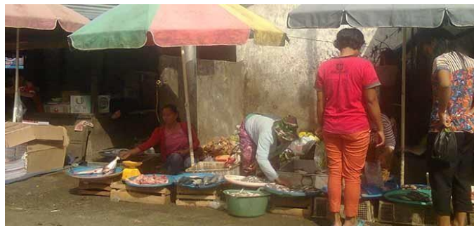
Gambar 4.2 Tempat Penjual Bahan Pangan Basah

Observasi dan pengisian lembaran checklist yang dilakukan mendapatkan hasil bahwasanya kondisi tempat penjual bahan pangan basah Dalam pengamatan peneliti bahwa variabel dan penilaian belum memenuhi syarat yaitu Seperti, Terdapat meja tempat penjualan, Karkas daging digantung, Alat pemotong (talenan) tidak terbuat dari kayu, tidak beracun, kedap air dan mudah dibersihkan. Karena penjual makanan basah tidak menggunakan meja. Jadi tinggal keluarkan saja keranjang yang sebelumnya digunakan untuk membawa barang basah.