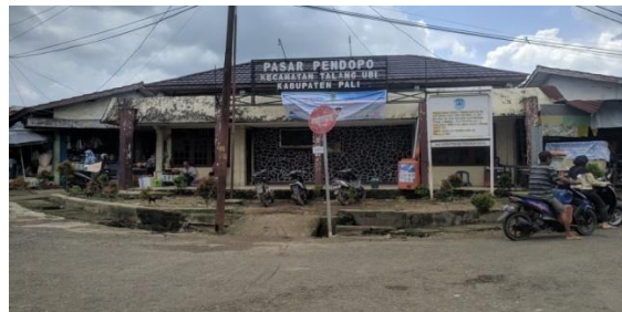
Gambar 4.1 Bangunan Pasar Pendopo

Pasar Pendopo adalah pasar tradisional yang berlokasi di antara Tiga Desa, Desa Talang Ubi Timur, Desa Talang Ubi Barat, Dan Desa Pasar Bayang Karah, Kecamatan Talang Ubi, Penukal Abab Kabupaten Lematang Ilir, Luas Pasar Pendopo, 1,3 ha, dengan 500 pedagang, 300 kios , dan 200 stand yang tercatat pada tahun 2021. Pasar pendopo buka setiap hari antara pukul 05.00 WIB hingga 17.00 WIB.