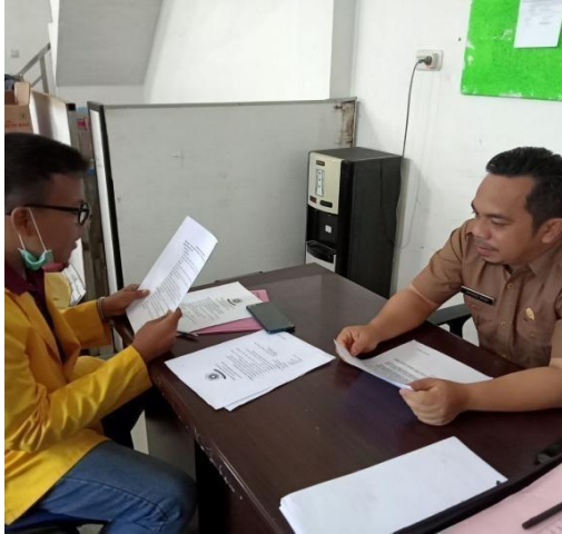
PIHAK DINAS PERINDUSTRIAN DAN PERDAGANGAN