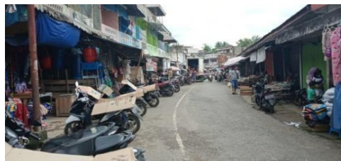
Gambar 4.5 Tempat Area Parkir

Menurut temuan wawancara mendalam, mobil yang mengantarkan unggas dan produk harus parkir di tempat parkir pasar. Karena kendaraan pengangkut unggas dan kendaraan bongkar muat barang parkir pada malam hari, maka tidak ada tempat parkir khusus. Berdasarkan temuan wawancara observasi mendalam dan lembar evaluasi checklist sanitasi pasar.