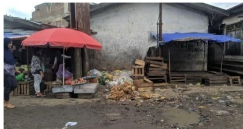
Gambar 4.7 Pengelola Sampah Di Pasar Pendopo

Berdasarkan hasil wawancara mendalam, perpindahan sampah dari setiap lorong gedung pasar tidak dapat diprediksi. Petugas menggunakan alat pelindung diri seperti sepatu boot dan sarung tangan. Pengangkutan sampah di tempat penampungan sementara (TPS) dilaksanakan sehari sekali oleh petugas kebersihan. Tempat penampungan sementara (TPS), menurut polisi, masih menjadi tempat berkembang biaknya vektor-vektor penyebab penyakit seperti lalat, tikus, dan kecoa.