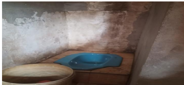
Gambar 4.6 Toilet Pasar Pendopo

Kamar mandi dan toilet merupakan hasil observasi langsung dan pengisian formulir checklist. Hal yang tidak sesuai pada penilaian yang dilaksanakan adalah kamar mandi dan toilet tidak dipisah untuk laki-laki dan perempuan, fasilitas belum memadai, tempat mencuci tangan dan sabun tidak disediakan, dan ventilasi lebih sedikit dari 20% dari permukaan lantai. Sedangkan penerangan di beberapa toilet masih kurang dari 100 lux setelah dilakukan pengukuran menggunakan lux meter.