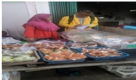
Gambar 4.4 tempat penjualan makanan siap saji

Wawancara mendalam menunjukkan bahwa vektor ada di lingkungan penjual makanan siap saji. Misalnya tikus, kecoa, dan lalat. Akibatnya, komponen penilaian tidak memenuhi standar evaluasi. Berdasarkan hasil wawancara mendalam, observasi, dan lembar evaluasi sanitasi pasar, ditarik kesimpulan bahwa dalam variabel tempat perdagangan makanan siap saji, banyak komponen penilaian yang tidak sesuai dengan standar penilaian. Akibatnya, sangat penting untuk menilai tempat penjualan dan meningkatkan fasilitas sanitasi seperti tong sampah, tempat cuci tangan, dan rute pembuangan limbah.