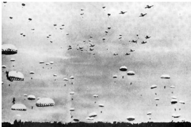
Gambar 1. Mendaratnya Jepang ke Palembang

Keberhasilan Jepang dalam menaklukkan Belanda ini tentunya karena strategi yang telah mereka susun, diketahui bahwa sebelum melakukan penyerangan. Jepang melancarkan kegiatan prakondisi melalui tindakan mata-mata ( Spionase ). Hal ini dilakukan untuk mengetahui keadaan Indonesia yang sesungguhnya serta melakukan penyelidikan terkait daerah yang mempunyai potensi. Maka dari itu, penyerangan selanjutnya menuju daerah selatan terutama pada pusat-pusat minyak di Asia Tenggara dapat terlaksana dengan lancar, seperti yang telah disinggung sebelumnya, minyak ini menjadi target yang penting bagi Jepang karena sumber daya alam negeri mereka terbatas (Ishak, 2012).