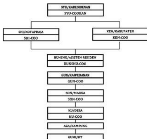
Gambar 3. Struktur Pemerintahan Palembang Syu dengan Syi didalamnya

Pada bagian pendahuluan telah disinggung, sebelum Jepang datang dan menjajah wilayah nusantara khususnya Palembang, terdapat sebuah sistem pemerintahan tradisional yang biasa disebut dengan marga, Istilah marga pun berganti menjadi Son pasca berkedudukannya Jepang di kota Palembang dan kepala pesirah (pemimpin marga) dikenal dengan Soncoo lalu dusun berganti nama menjadi Ku sedangkan kepala kerio menjadi buncoo (Ismail, 2004: 42).