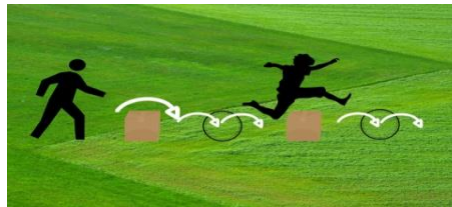
Gambar 1.1 kombinasi

Berdasarkan penelitian ini adalah “pengembangan model pembelajaran gerak dasar lompat berbasis permainan tradisional”. Penelitian ini dikembangkan untuk produk gerak dasar lompat berbasis permainan