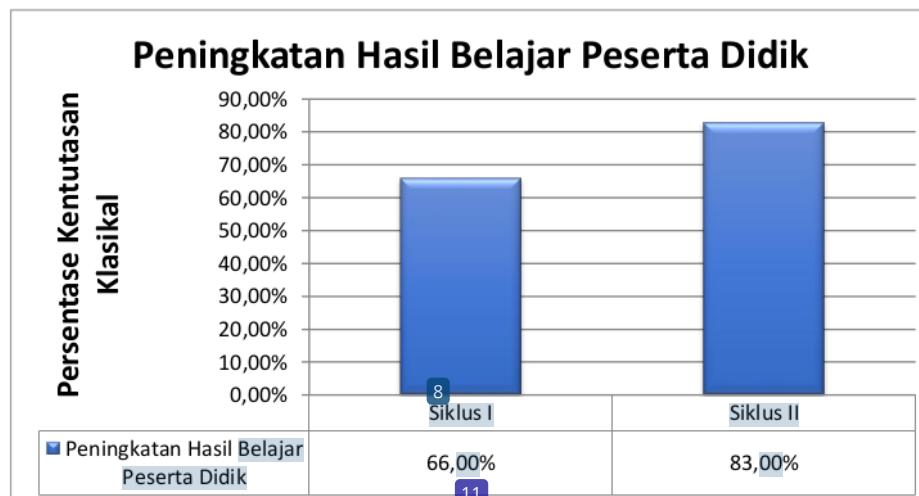
Gambar 1. Diagram Hasil Belajar Peserta Didik Siklus I, dan Siklus II

Dari data di atas dapat diketahui bahwa hasil belajar peserta didik kelas IV pada siklus II sudah mencapai ketuntasan tetapi masih ada yang belum tuntas, hasil belajar peserta didik SD Negeri 057 Palembang pada penelitian siklus II mencapai ketuntasan 83% belajar sesuai dengan yang diharapkan. Kemudian dilihat dari keaktifan peserta didik pada siklus II meningkat mencapai sebesar 83%. Tindakan kelas hanya dilakukan sampai pada siklus II karena hasil belajar dan keaktifan peserta didik sudah memenuhi indikator pencapaian penelitian yang ditetapkan.