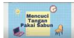
Gambar 1.4 Video Teks Prosedur Sederhana