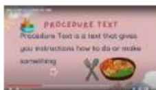
Gambar 1.5 Video Procedure Text