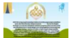
Gambar 1.8 Video Teks Cerpen