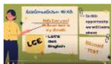
Gambar 1.7 Video Recount Text