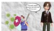
Gambar 1.1 Video Teks Prosedur Kompleks

Terdapat delapan desain dan produksi media pembelajaran bahasa yang dihasilkan peserta kegiatan.