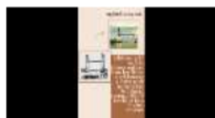
Gambar 1.2 Video Teks Deskripsi