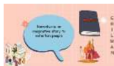
Gambar 1.3 Video Narrative Text