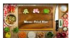
Gambar 1.6 Video Procedure Text