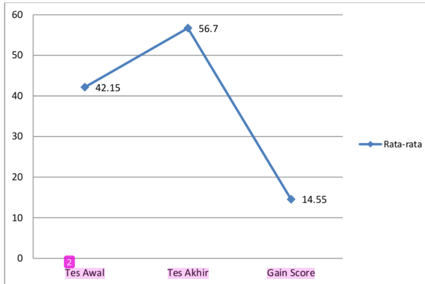
Grafik 1 Rerata Skor Tes Awal, Tes Akhir, dan Gain Score

Berikut disajikan grafik yang berkaitan dengan tes awal dan tes akhir menulis naskah drama Dulmuluk .