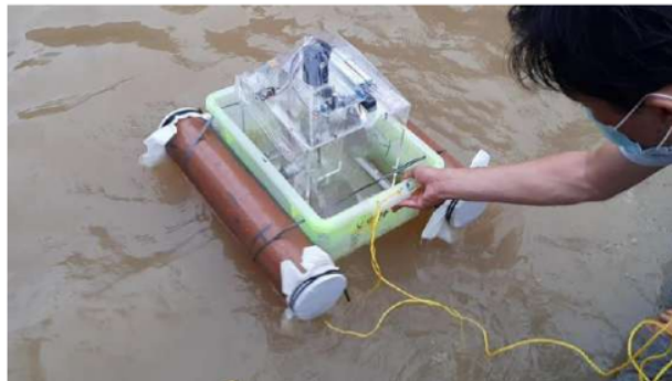
Gambar 3. Pengujian PLTGL

Saat gimpal berputar dan menggerakkan PTO generator , PTO generator hanya mampu menghasilkan tegangan sesaat kemudian hilang karena tegangan yang dikeluarkan belum mampu disimpan didalam kapasitor. Oleh karena itu diperlukan rangkaian pengendali tegangan PTO generator agar tidak langsung hilang, yaitu dengan menambahkan jembatan dioda, dan kapasitor serta penggunaan DC to DC voltage converter . Gambar 3 merupakan pengujian PLTGL untuk melihat pengaruh putaran gimpal terhadap nilai tegangan keluaran dari PTO generator .