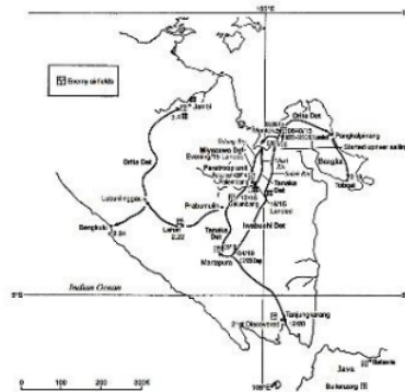
Gambar 1. Garis besar operasi unit Pasukan Jepang Angkatan Darat Divisi 38

Kota Palembang masuk dalam cetak biru Jepang dengan kode operasional “L” (Lohnstein, 2021, p. 28; Rimmelink, 2018, ppp. 208&258). Palembang menjadi sasaran utama Jepang karena setengah dari produksi minyak di Hindia Belanda mengalir melalui kota itu (Tanjung, 2015). Posisi Palembang juga dipandang penting oleh Jepang karena memiliki sumber daya alam lain seperti batu bara, timah, karet, kelapa sawit, dan sebagainya, bagi keperluan perang (Abubakar et al. , 2020, p. 111).