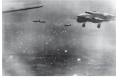
Gambar 2. Pasukan parasut Jepang di langit Palembang

Taktik “Blitzkrieg” atau “serangan kilat” Jepang dilancarkan pada tanggal 14 Februari 1942 melalui serangan udara dengan meluncurkan Pasukan Parasut masuk dan menduduki kota Palembang (Plaju, 1999, p. 5). Sekitar 700 penerjun payung Jepang diturunkan di dan dekat bandar udara Palembang dan kilang minyak (Nortier, 1985). Pengiriman pasukan parasut dalam dua gelombang. Setiap gelombang diturunkan sebanyak 350 pasukan dari ketinggian 600 kaki (Division, 1945, p. 25). Pun rujukan Tanjung (2015) mengatakan terdapat 600 pasukan payung mendarat di salah satu lapangan terbang dan dua kompleks kilang minyak Plaju, pertahanan Sekutu tidak bisa membendung laju musuh. Masih dalam strategi bumi hangusnya, Belanda melenyapkan pabrik, penyulingan minyak tersebut serta ratusan rumah, gudang, kantor, bengkel, hingga jaringan pipa ke lokasi pengeboran dan sumur itu sendiri juga hancur dalam kobaran api (Heurn, 1945, p. 55). Sedangkan disisi pertahanan KNIL Belanda di Palembang sendiri dalam keadaan tidak siap menghadapi serangan Jepang (Hanafiah et al. , 2001, p. 18).