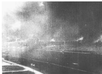
Gambar 3. Kilang minyak Sungai Gerong yang penuh dengan gumpalan asap akibat strategi bumihangus Sekutu

Taktik “Blitzkrieg” atau “serangan kilat” Jepang dilancarkan pada tanggal 14 Februari 1942 melalui serangan udara dengan meluncurkan Pasukan Parasut masuk dan menduduki kota Palembang (Plaju, 1999, p. 5). Sekitar 700 penerjun payung Jepang diturunkan di dan dekat bandar udara Palembang dan kilang minyak (Nortier, 1985). Pengiriman pasukan parasut dalam dua gelombang. Setiap gelombang diturunkan sebanyak 350 pasukan dari ketinggian 600 kaki (Division, 1945, p. 25). Pun rujukan Tanjung (2015) mengatakan terdapat 600 pasukan payung mendarat di salah satu lapangan terbang dan dua kompleks kilang minyak Plaju, pertahanan Sekutu tidak bisa membendung laju musuh. Masih dalam strategi bumi hangusnya, Belanda melenyapkan pabrik, penyulingan minyak tersebut serta ratusan rumah, gudang, kantor, bengkel, hingga jaringan pipa ke lokasi pengeboran dan sumur itu sendiri juga hancur dalam kobaran api (Heurn, 1945, p. 55). Sedangkan disisi pertahanan KNIL Belanda di Palembang sendiri dalam keadaan tidak siap menghadapi serangan Jepang (Hanafiah et al. , 2001, p. 18).