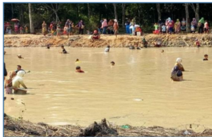
Gambar 1: Proses Pelaksanaan Tradisi Nanggok Ikan di Prabumulih.

Nanggok ikan adalah kegiatan mengambil ikan di sungai yang dilakukan secara berkelompok. Biasanya kegiatan ini hanya dilakukan oleh masyarakat dan telah menjadi rutinitas setelah musim kemarau tiba.