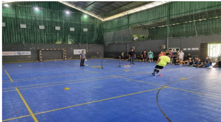
Gambar 3. Pelaksanaan uji coba skala besar

Dari tabel 9 menunjukkan hasil signifikan 2 tailed 0.525 yang artinya tidak terdapat perbedaan yang signifikan antara hasil ukur tes menggunakan sensor dan secara manual menggunakan stopwatch . Maka dari hasil empat uji statistik diatas dapat ditarik kesimpulan bahwa alat ukur tes kelincahan berbasis teknologi sensor infrared dapat digunakan sebagai alat bantu ukur tes kelincahan.