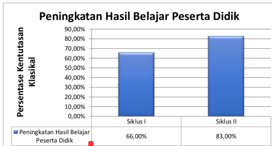
Gambar 1. Diagram Hasil Belajar Peserta Didik Siklus I, dan Siklus II

Dari data di atas dapat diketahui bahwa hasil belajar peserta didik kelas IV pada siklus II sudah mencapai ketuntasan tetapi masih ada yang belum tuntas, hasil belajar peserta didik SD Negeri 057 Palembang pada penelitian siklus II mencapai ketuntasan 83% belajar sesuai dengan yang diharapkan. Kemudian dilihat dari keaktifan peserta didik pada siklus I meningkat mencapai sebesar 83%. Tindakan kelas hanya dilakukan sampai pada siklus II karena hasil belajar dan keaktifan peserta didik sudah memenuhi indikator pencapaian penelitian yang ditetapkan.