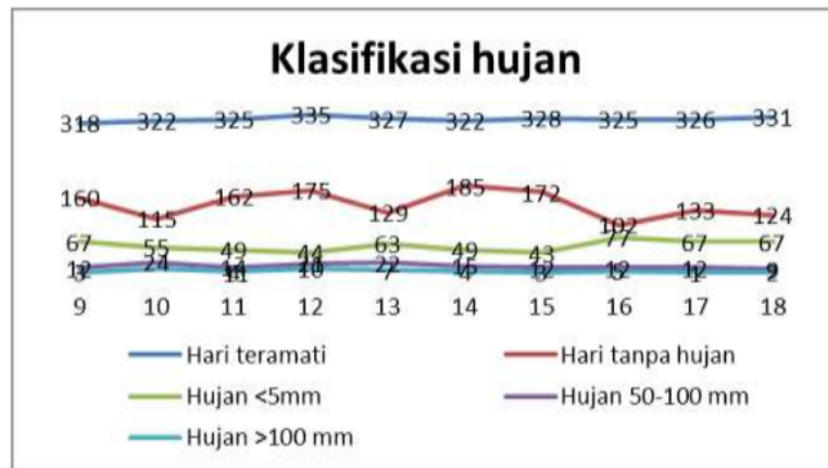
Gambar 1. Deskripsi jumlah hari berdasarkan kategori curah hujan

hujan sangat ringan, proporsinya menjadi lebih dari 1/2 sampai lebih dari 2/3 dari hari teramati. Bila diperhatikan perkembangan jumlah hari tanpa hujan dan hujan sangat ringan pada 3 tahun terakhir ada sedikit perubahan dari tahun-tahun sebelumnya. Perubahan tersebut adalah berkurangnya hari tanpa hujan dan bertambahnya hari dengan hujan sangat ringan. Artinya beberapa hari yang tidak hujan berubah menjadi hujan sangat ringan. Sedikit perubahan juga tampak pada hujan sangat lebat yaitu hujan lebih 100 mm per hari. Hujan sangat lebat terbanyak adalah pada Tahun 2010 sebanyak 11 hari dan Tahun 2012 sebanyak 10 hari. Terjadi penurunan hingga hanya 2 dan 1 hari di Tahun 2017 dan 2018. Penurunan juga terjadi pada hari dengan hujan lebat dari lebih dari 20 hari pada tahun 2010 -2014 menjadi 12 dan 9 di tahun 2015 - 2018. Berdasarkan deskripsi hari pengamatan curah hujan tersebut dapat disimpulkan bahwa curah hujan di Palembang lebih menuju ke pemerataan curah hujan sepanjang tahun.