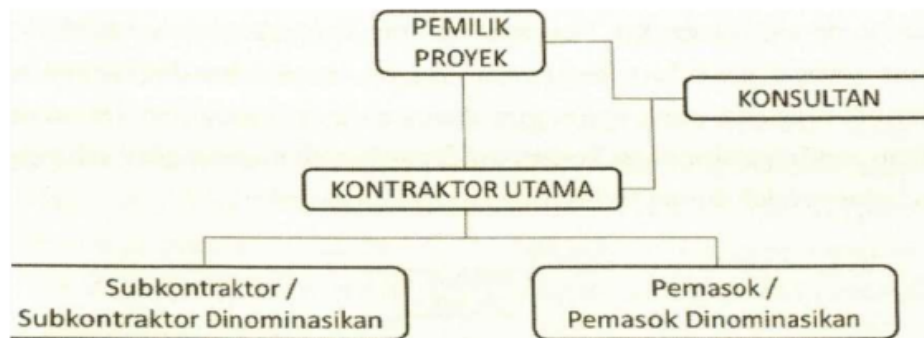
Gambar 1 Bentuk kontrak konvensional/tradisional

pembagian tugas pada kontrak konvensional dapat dilihat ada gambar berikut.