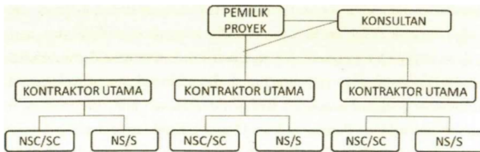
Gambar 2. Bentuk kontrak spesialis

Bentuk kontrak selanjutnya yakni bentuk kontrak design-build —se- ring disingkat DB—adalah bentuk kontrak di mana kontraktor tidak hanya bertanggung jawab atas pelaksanaan konstruksi tetapi juga terhadap desain konstruksi. Dengan demikian kontraktor utama berfungsi pula sebagai konsultan perencana. Tujuan utama dari diterapkannya bentuk ini adalah agar waktu perencanaan dan perancangan desain dengan waktu pelaksanaan konstruksi dapat berjalan overlapping sehingga memperpendek durasi siklus hidup proyek konstruksi.