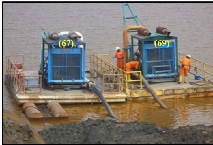
Gambar 2. Pompa Sulzer 385 kW (67) dan Sulzer 385 kW (69)