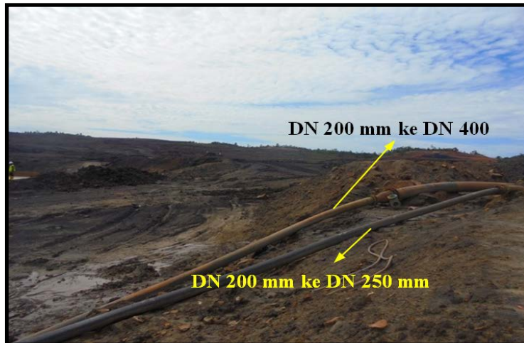
Gambar 3. Instalasi Perpipaan pada Pit 1 Timur