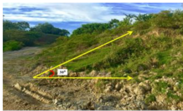
Gambar 1. Realisasi bentuk lereng disposal selatan

Pada rencana pengaturan bentuk lereng untuk area penimbunan area reklamasi, perusahaan merencanakan pembuatan level sesuai elevasi . Pembuatan slope (sudut kemiringan) untuk lereng sekitar < 45 0 dengan mempertimbangkan kondisi lapangan agar tidak terjadinya longsoran. Setelah dilakukan peninjauan dilapangan, didapatkan realisasi pengaturan bentuk lereng memiliki slope sekitar 30 0 dan telah sesuai dengan yang telah direncanakan (Gambar 1).