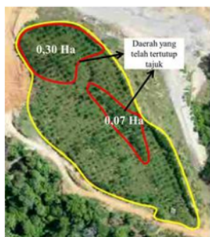
Gambar 4. Realisasi penutupan tajuk

Persentase penutupan tajuk juga merupakan salah satu poin yang harus diperhatikan sebagai bentuk penyelesaian akhir terhadap kegiatan reklamasi yang dilakukan. Oleh sebab itu, perusahaan merencanakan persentase penutupan tajuk sebesar \geq 80\% sebagai tolak ukur keberhasilan. Pengamatan dilakukan melalui gambar citra udara untuk menemukan seberapa besar persentase penutupan tajuk terhadap keseluruhan luas disposal selatan. Berdasarkan hasil penelitian, daerah yang telah tertutup tajuk adalah seluas 0,37 Ha dengan persentase sebesar 38% (Gambar 4). Hal ini karena umur tanaman baru \leq 2 tahun.