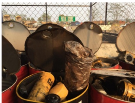
Gambar 8. Limbah B3 Filter Bekas

Filter bekas (Gambar 8) dimasukkan dalam drum dengan kapasitas \pm 87 kg.