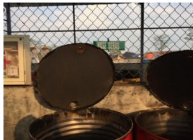
Gambar 10. Limbah B3 Hose Bekas

Limbah hose bekas (Gambar 10) dimasukkan dalam drum dengan kapasitas \pm 90 kg.