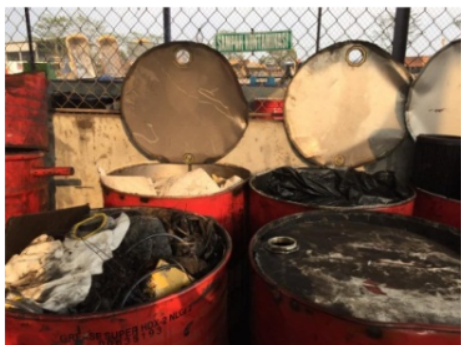
Gambar 9. Limbah B3 Majun Terkontaminasi

Kapasitas untuk pengumpulan majun terkontaminasi ini yaitu : \pm 166 kg. Gambar 9 menunjukkan limbah B3 majun terkontaminasi