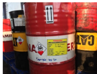
Gambar 11. Limbah B3 Oli Bekas

PT.X menghasilkan limbah tersebut berupa oli bekas (Gambar 11) dimana kapasitasnya yaitu \pm 200 liter per drum.