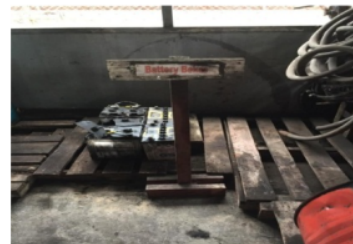
Gambar 7. Macam-Macam Limbah B3 di TPS