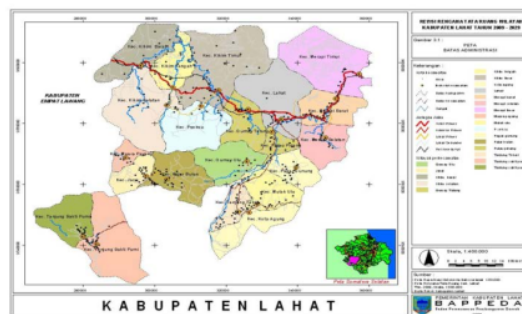
Gambar 1. Peta Administrasi Kabupaten Lahat

Penelitian dilakukan di Provinsi Sumatera Selatan khususnya Kabupaten Lahat (Gambar 1) dengan mengambil beberapa data sekunder, baik dari Dinas Lingkungan Hidup (DLH) maupun perusahaan tambang di Lahat dengan studi kasus PT.X. Kegiatan ini dilakukan pada 10 Oktober 2019 sampai 16 Oktober 2019.