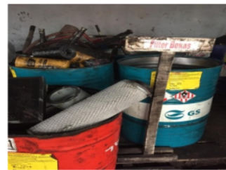
Gambar (5) dan (6). Workshop dan Tempat Penyimpanan Sementara Limbah B3