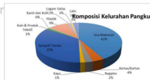
Gambar 2. Komposisi Sampah Kelurahan Pangkul

Analisa komposisi sampah di Kelurahan Pangkul menunjukkan persentase komponen sampah organik di Kelurahan Pangkul sebesar 77% terdiri dari sisa makanan dan sampah taman selebihnya merupakan komponen sampah non organik. Jenis sampah sisa makanan dan sampah taman mendominasi jenis sampah rumah