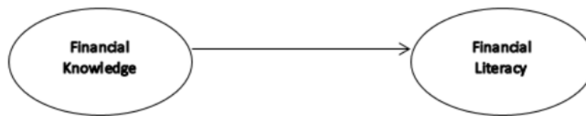
Gambar 1. Pengaruh Financial Knowledge terhadap Financial Literacy